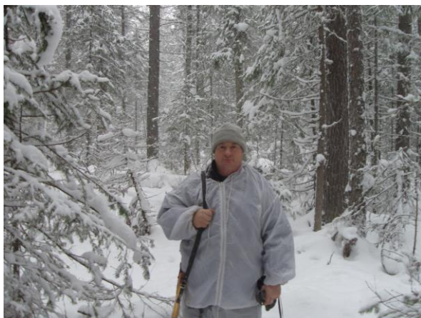
На любительской зимней охоте в декабре 2015 г.