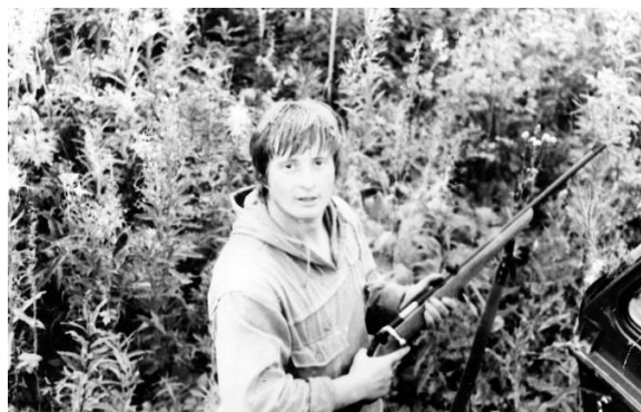
Страсть к охоте зародилась смолоду.

Увлечен любительской охотой, профессионально занимается охраной природы и животного мира.