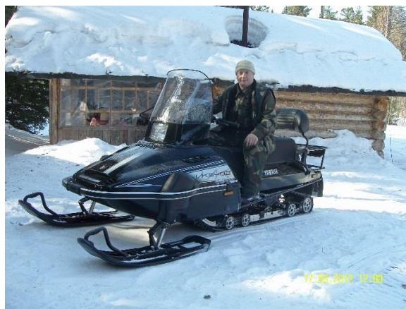
В рейде в охотничьих угодьях по охране животного мира в марте 2012 г.